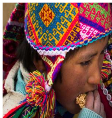
Almuerzo en una casa local de la comunidad de Chujuno