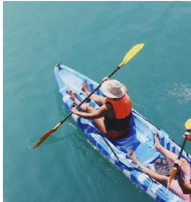
Jornada de Kayak en el lago en la Laguna Piuray