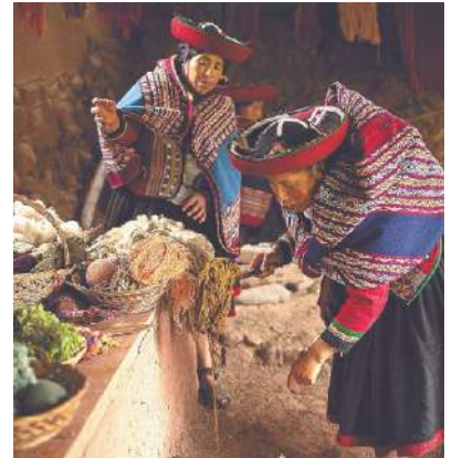
Visita de la comunidad de Ccorcor, en el Valle Sagrado y Preparación de la Pachamanca