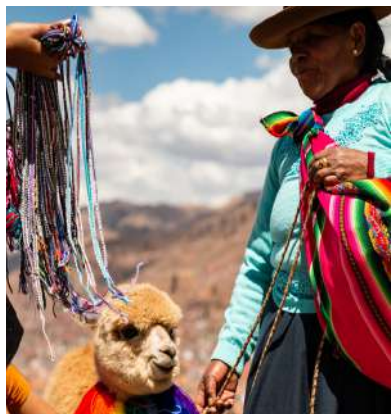
Visita del Museo Vivo de Yucay