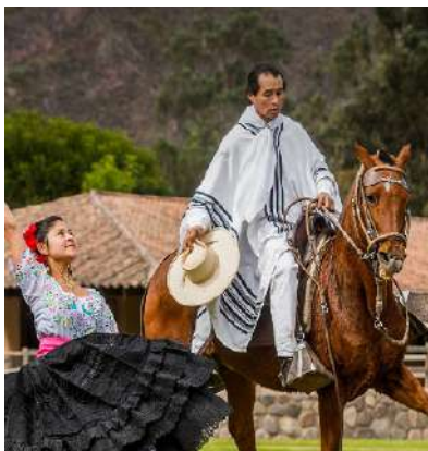
Almuerzo en Rancho Wayra con Show de caballos de paso