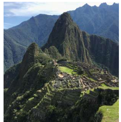
Dos visitas incluidas a Machu Pichu